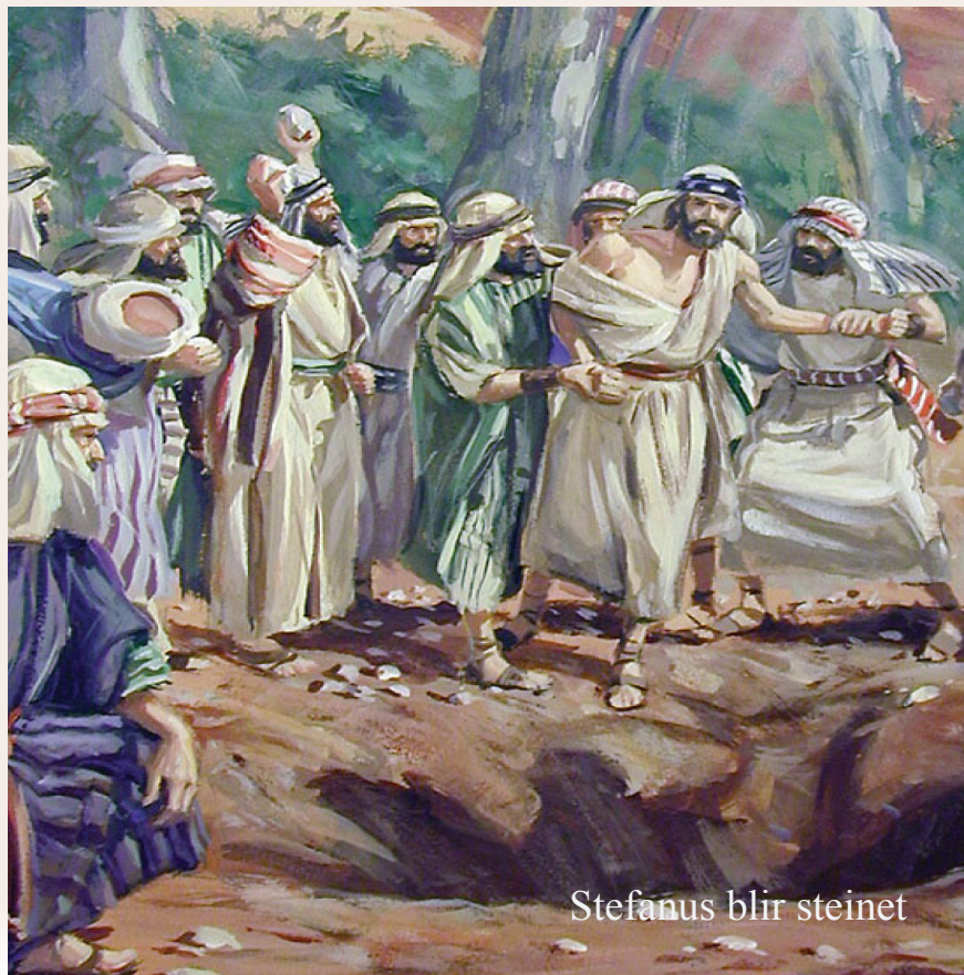
Stefanus blir steinet

Hestens mat blir velsignet på denne dagen med høy og havre. Man kastet disse velsignede havrekorn på